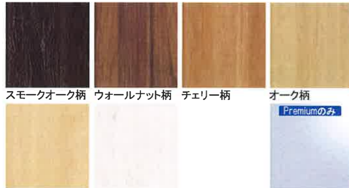
スモークオーク柄 ウォールナット柄 チェリー柄 オーク柄 Premiumのみ Maple柄 ホワイトオーク柄 シックいホワイト柄 鏡面ピュアホワイト柄