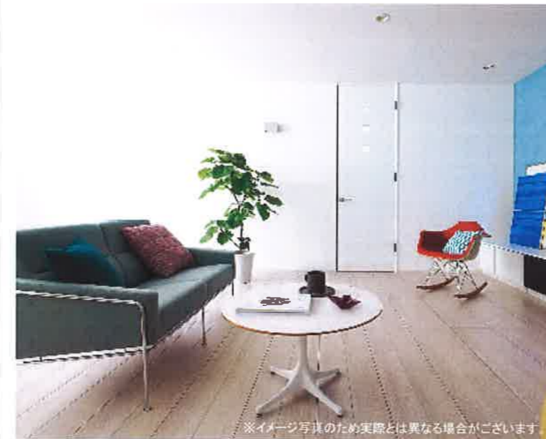
※イメージ写真のため実際とは異なる場合がございます。