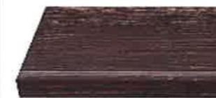
スモークオーク柄