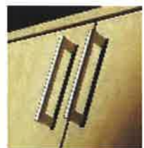
T2型 サテンシルバー色 (塗装)