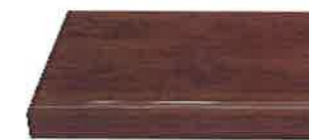
ウォールナット柄