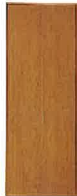
PA型 (フラットタイプ)