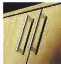
T2型 サテンシルバー色 (メッキ)