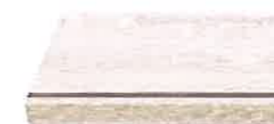
ホワイトオーク柄