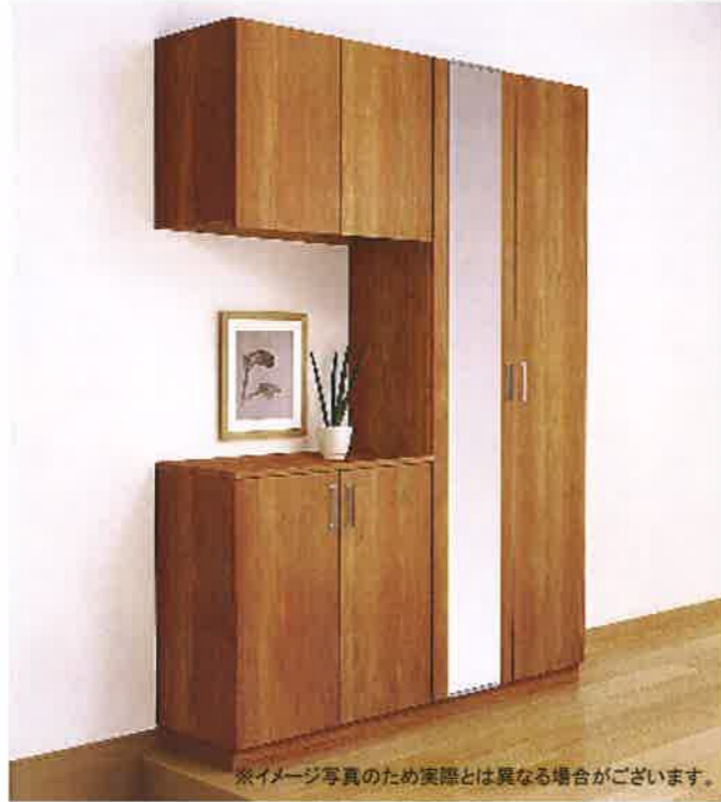
※イメージ写真のため実際とは異なる場合がございます。