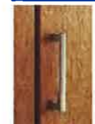
T2型(丸型取っ手) サテンシルバー色 (メッキ)