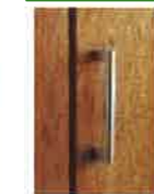
T2型(丸型取っ手) サテンシルバー色 (塗装)